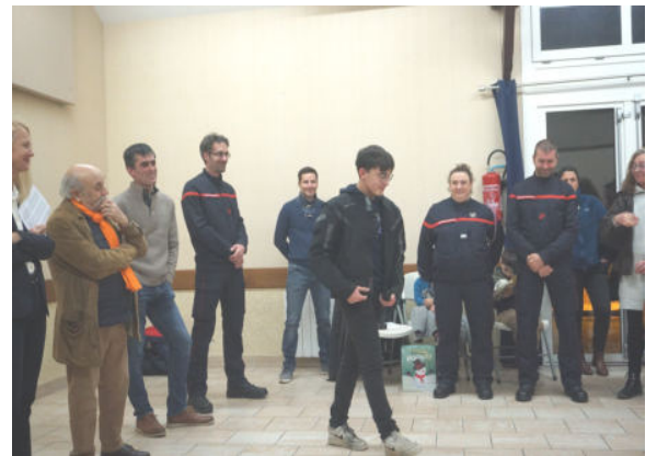
Vœux du Maire le 3 janvier