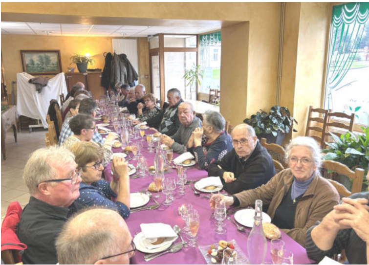
Repas des anciens 14 décembre