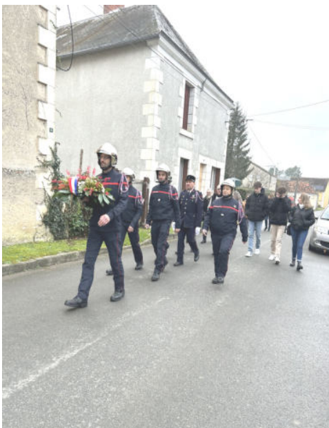
Sainte Barbe 14 décembre