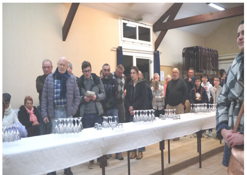
Vœux du Maire le 3 janvier