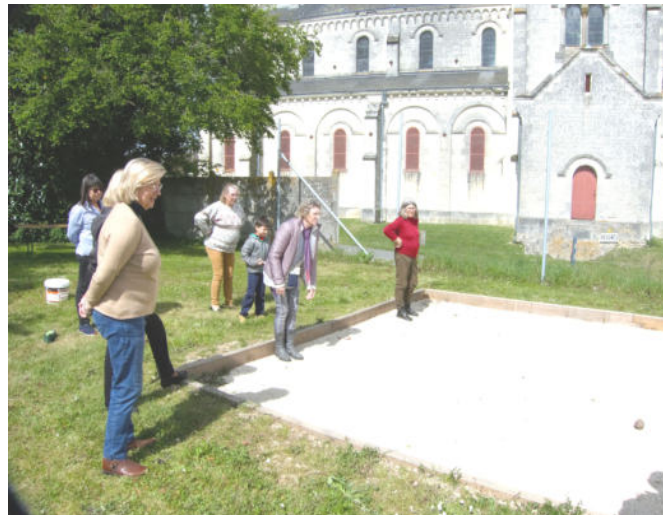
Inauguration du terrain de pétanque le 20 avril