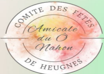
Photo mystère ...

Renseignements au 06.08.02.08.46 et 02.54.39.01.85