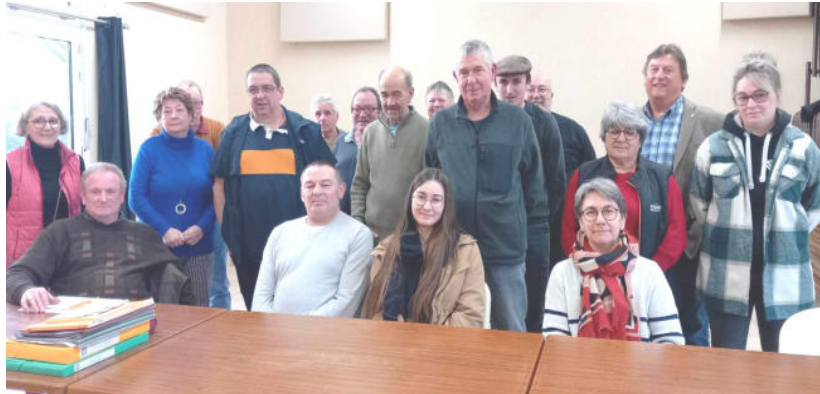
Assemblée générale du comité des fêtes

On espère vous voir nombreux. À bientôt !