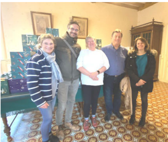
Colis de Noël