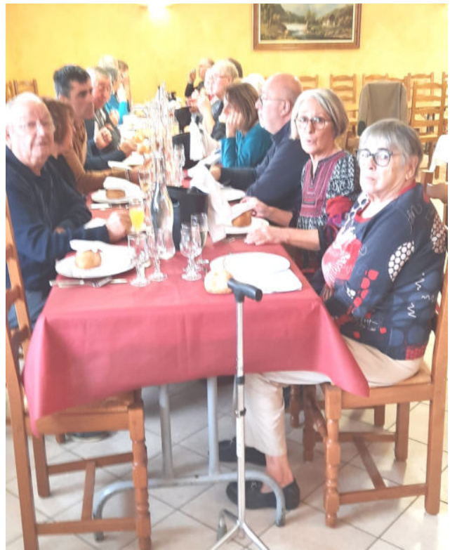
Repas pour les Aînés