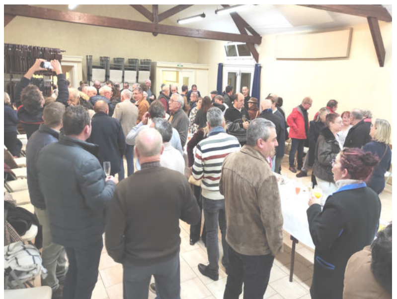
Vœux du Maire, le vendredi 5 janvier 2024

Merci à toutes et tous pour votre participation à cet événement.