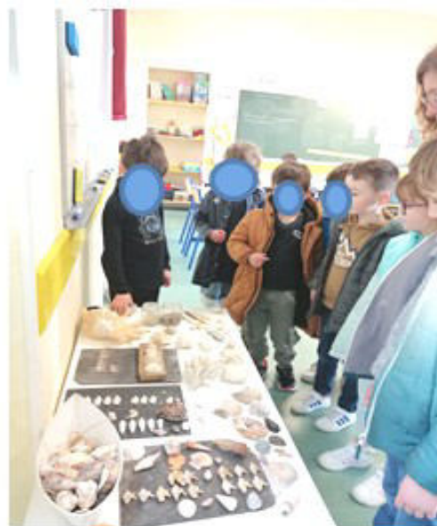
Exposition de coquillages créée et commentée par un élève

Pour clôturer l'année, les élèves de maternelle et les élèves de Heugnes iront à « La maison de l'eau » (Neuvy-sur-Barangeon) le Mardi 16 mai.