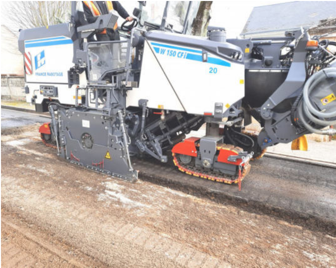
Travaux de voirie Route d'ECUEILLE ( 22/03)