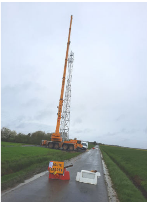
Travaux mât téléphonie (04/04)