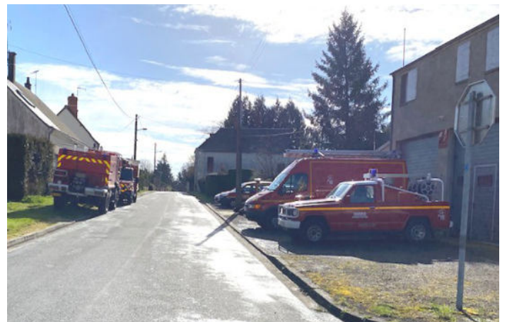
Manœuvres des pompiers ( 18/03)