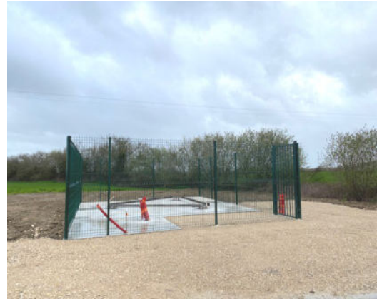
Travaux mât téléphonie (31/03)