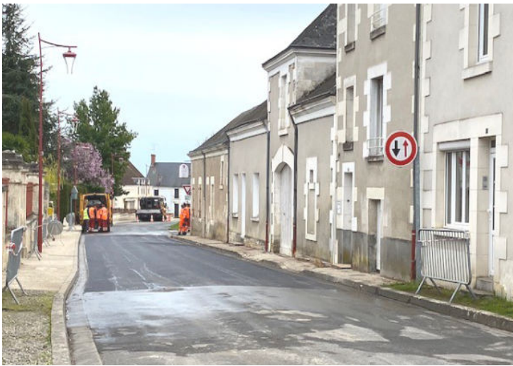
Travaux de voirie Route d'ECUEILLE