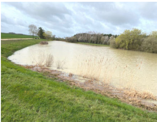
Étang de la Biche ( 25/03)