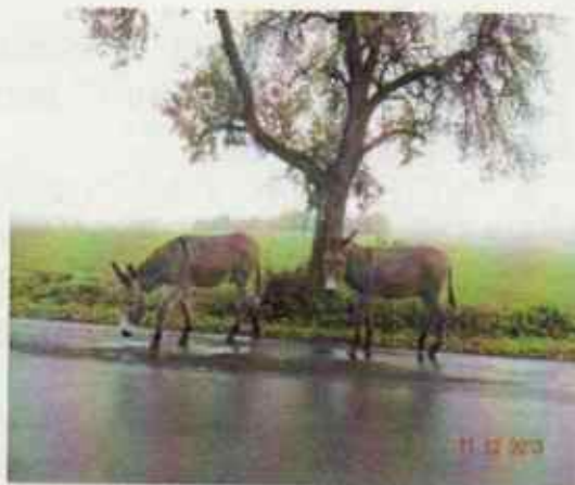
11 décembre Route de Pellevoisin Randonneurs insolites