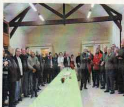
3 Janvier 2014 Vœux de Monsieur Le Maire