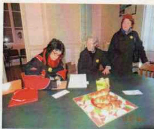
7 décembre – TELETHON 2013 – Passage à Heugnes