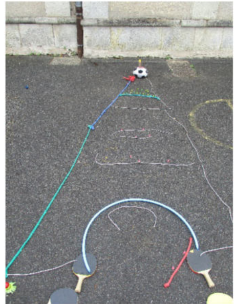
La tour Eiffel version Recycl'art

Les élèves ont tenu à remercier l'exploitant agricole qui nous a offert les bottes de foin en réalisant un dessin collectif.