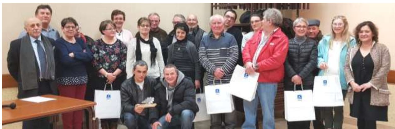
Cérémonie du 8 mai 1945