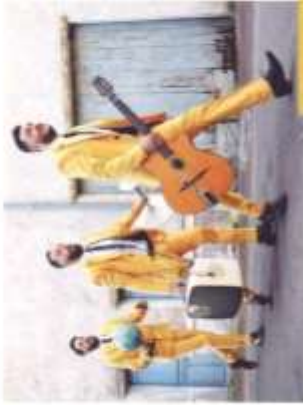
20h Concert Tout public "Des tubes et du swing" (2017)

Avec 350 concerts à son actif, le trio sort son premier album, « Des tubes et du Swing ». L'occasion de vous embarquer avec malice et humour vers le nec plus ultra des années 80 : des costards à rendre jaloux Bernard Tapie, un décor et des vidéos dernier cri, pixels à l'appui, et, bien entendu, des hits ! Goldman, France Gall, Les Rita Mitsouko, La Mano... mais aussi quelques fameux allers-retours entre les sixties et l'an 2000. Et quelques touches d'electro-swing un brin kitsch mais toujours classe !