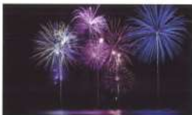
21h Pyrotechnie Tout public

Une création originale pour sublimer l'étang de Rouvres-les-Bois avec un artiste pyrotechnique local !