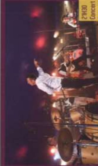
21h30 Concert Tout public "With real soul cuts 1" (2008)