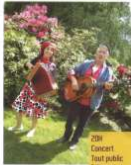
20h Concert Tout public "Marcel et Marcelle"

Deux voix, le féminin et le masculin, le rythme et la mélodie, la guitare et l'accordéon, un duo festif et musical qui interprète des chansons françaises connues ou méconnues, d'hier et d'aujourd'hui, avec le cœur et l'énergie de deux musiciens qui aiment ce qu'ils font et le font partager... Eh oui, Marcel et Marcelle sont là pour vous donner des ailes et vous rendre la vie plus belle !!!