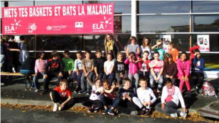
Cross de la classe de CE2, CM1 et CM2 à Ecueillé