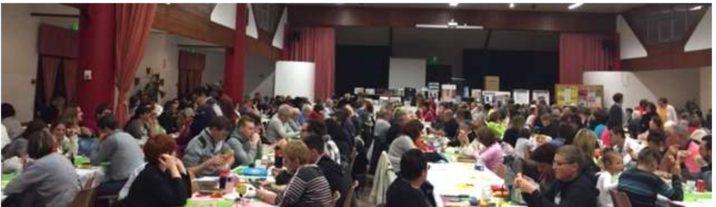
Une salle bondée pour le loto du Comité des Fêtes... Avec 370 adultes et 24 enfants dont une petite de 9 ans qui a gagné un lot malgré elle.