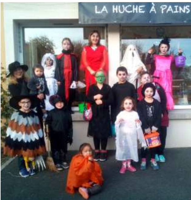
Les « Petits Monstres » pour Halloween.