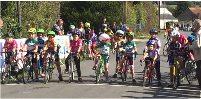
Course des écoles de cyclisme en septembre ...